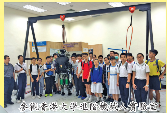
參觀香港大學進階機械人實驗室