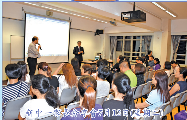
新中一家長分享會7月12日(星期二)