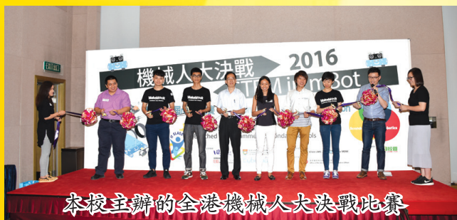
本校主辦的全港機械人大決戰比賽