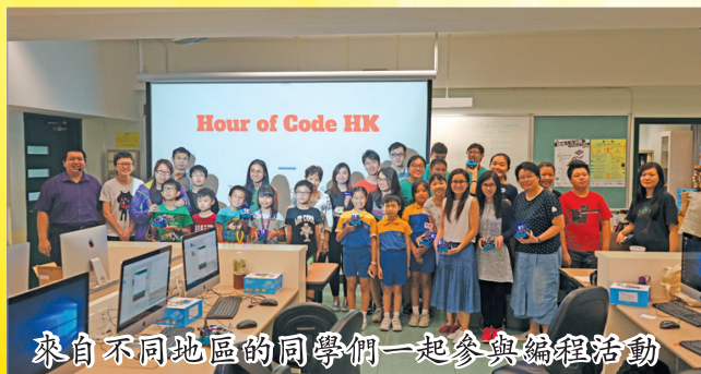
來自不同地區同學們一起參與編程活動

本校開辦的課程包括創意電影、航拍、流動應用程式、機器人、三維模型、立體打印、程式編寫及智能家居技術等。除本校專科教師外，亦邀得大學、專業團體及業內人士擔任導師，務求為學生提供最貼近社會實際需要的培訓，建立穩固的基礎。此外，校方亦安排實習培訓和參觀活動，讓學生進一步接觸真實的企業環境。