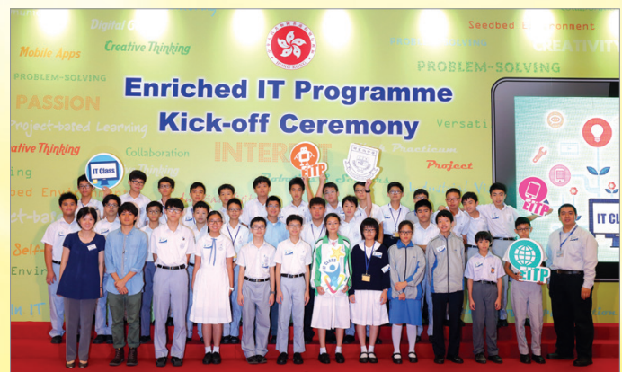
第一屆資訊科技增潤計劃啟動禮