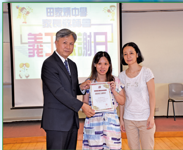
義工感謝日7月12日(星期二)