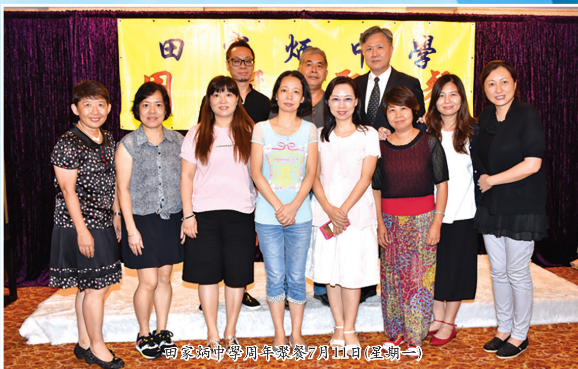
田家炳中學周年聚餐7月11日(星期一)