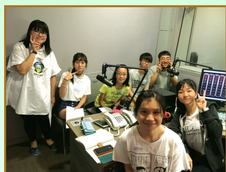
HSMC Summer Camp