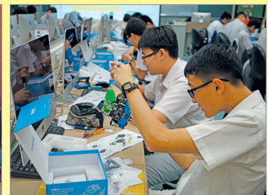
同學們正嘗試組裝機械人