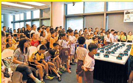
小學生亦非常投入參與比賽