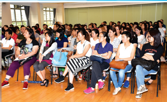
中一新生家長輔導日8月14日(星期日)