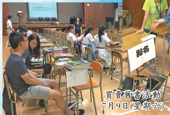
買賣舊書活動 7月9日(星期六)