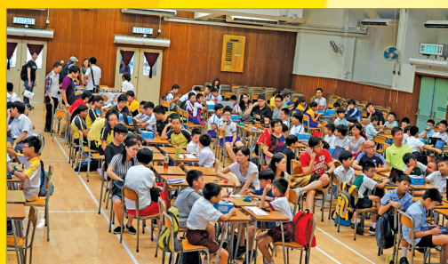
全港性機械人活動培訓，全場滿座