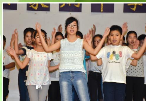
Pre-S1 Summer Bridging Course